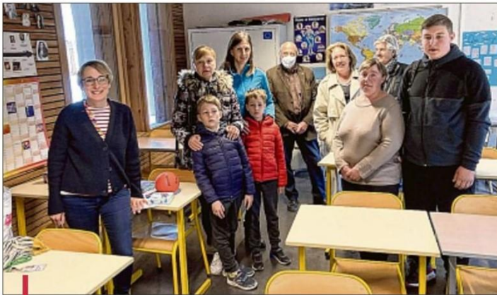
Les mercredis après-midi, de 14 h à 16 h, les réfugiés (enfants, adolescents ou parents) pourront s'initier au français.

De ce constat est née la dernière initiative mise en place depuis mercredi dernier. Grâce à l'aide de l'École Internationale,