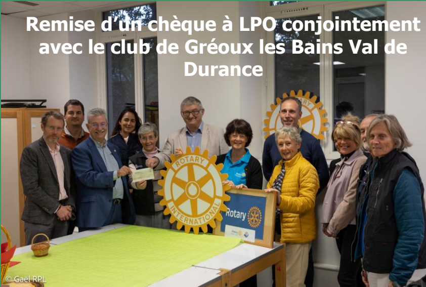
Remise d'un chèque à LPO conjointement avec le club de Gréoux les Bains Val de Durance