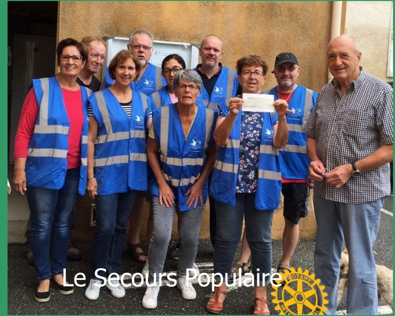
Le Secours Populaire