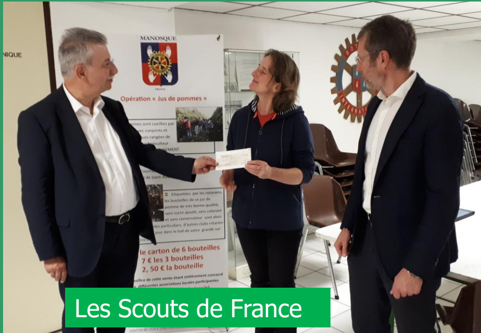
Les Scouts de France