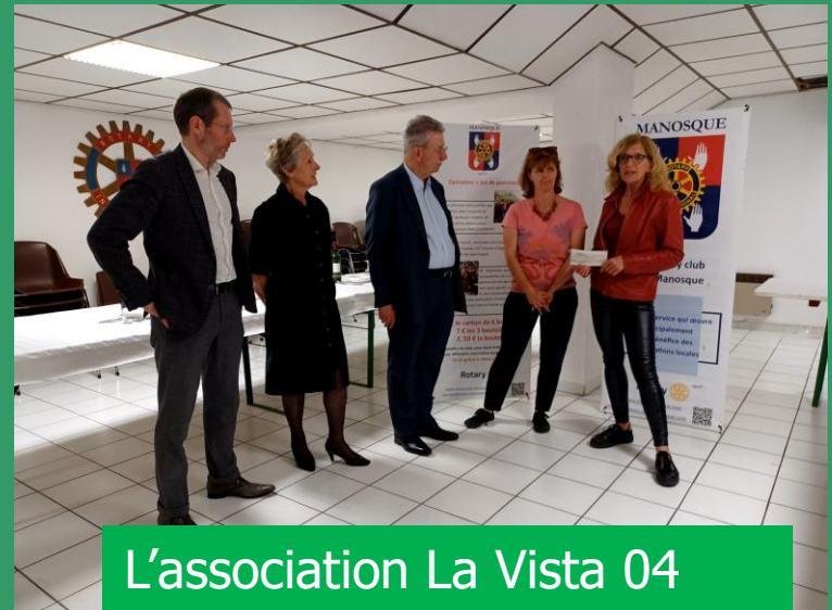
L'association La Vista 04