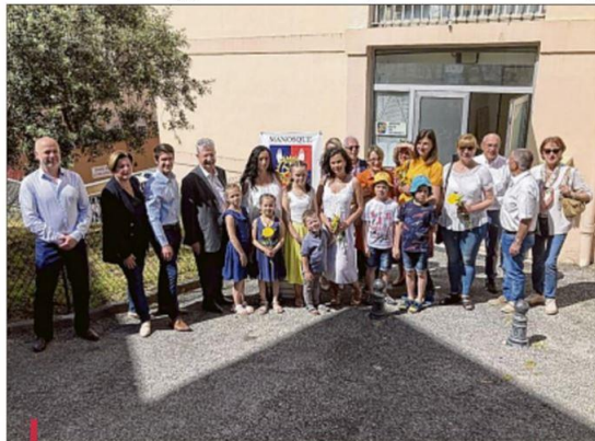
La remise de clés symbolique s'est déroulée samedi matin dans les locaux du Rotary Club de Manosque.

nous sommes heureux d'aider, d'autant plus qu'il y a un vrai critère d'urgence dans cette situation." Si un appartement n'a nécessité qu'un léger rafraîchissement au niveau de la peinture,