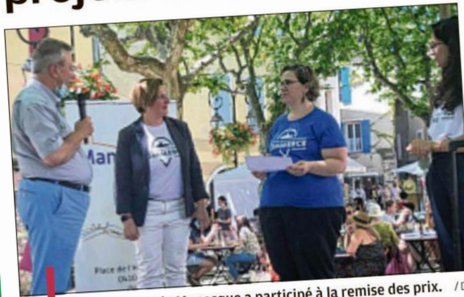
Le Rotary club de Manosque a participé à la remise des prix.

C'est un marathon de 36 heures qui attendait les porteurs de projet, les 16 et 17 juillet dernier à Manosque. Dans le cadre du concours "Mon centre-ville a un incroyable commerce", programme reconnu par la Banque des Territoires qui s'insère dans le plan "Action cœur de ville", plusieurs prix ont été décernés à des challengers