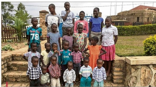
Les enfants devant la maison construite par l'association caritative FNKD pour les accueillir.