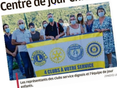
Les représentants des clubs service dignois et l'équipe de jour enfants.